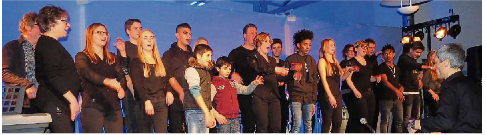
Das „HeimatMusik“-Orchester begeisterte in der Sparkassen-Aula.

Bei seinem Beginn vor einem halben Jahr stand „HeimatMusik“ vor der ganz praktischen Herausforderung, nicht nur Menschen mit einem ganz unterschiedlichen kulturellen Hintergrund zusammen zu bringen, sondern vor allem auch Menschen mit völlig unterschiedlichem musikalischen Hintergrund und Kenntnisstand. Durch Bewegung, Rhythmus